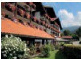
Hotel Schillingshof **** Fallerstr. 11 82433 Bad Kohlgrub 245 Betten Verpflegung möglich