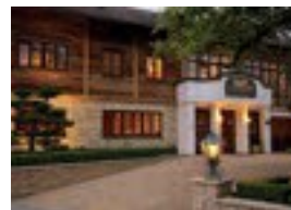
Ammergauer Zeitgeist **** Saulgruber Str. 6 82433 Bad Kohlgrub 70 Betten Verpflegung möglich