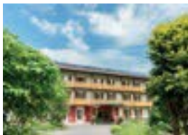
Das SeinZ Kurhausstr. 1 82433 Bad Kohlgrub 85 Betten Verpflegung möglich