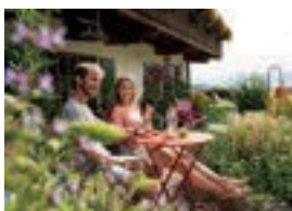
moor&mehr, Bio-Kurhotel ***S Spengelstr. 6 82433 Bad Kohlgrub 44 Betten Verpflegung möglich