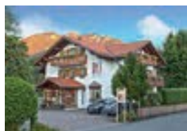
Hotel Garni Antonia *** Freikorpsstr. 5 82487 Oberammergau 25 Betten nur Frühstück möglich