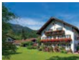
Gästehaus Stadler ** Rottenbucher Str. 6 82487 Oberammergau 20 Betten nur Frühstück möglich