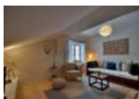
Hotel Fux *** Mannagasse 2a 82487 Oberammergau 26 Betten nur Frühstück möglich