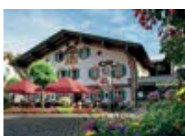
Hotel Alte Post *** Dorfstr. 19 82487 Oberammergau 82 Betten Verpflegung möglich