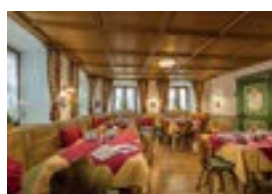
Gästehaus Enzianhof *** Ettaler Str. 33 82487 Oberammergau 28 Betten nur Frühstück möglich