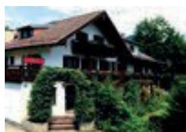
Das Posch Hotel Turnerweg 4 82487 Oberammergau 35 Betten nur Frühstück möglich