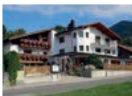
Hotel Arnika ***S Ludwig-Lang-Str. 21 82487 Oberammergau 64 Betten nur Frühstück möglich