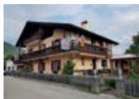
Gästehaus Otto Huber *** Welfengasse 8 82487 Oberammergau 26 Betten, nur Frühstück möglich