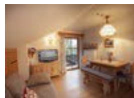
Kur- und Wellnesshotel Waldruh ***S Sonnen 93 82433 Bad Kohlgrub 31 Betten Verpflegung möglich