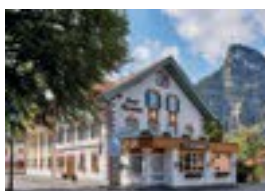
Zum Turm ***S Ettaler Str. 2 82487 Oberammergau 55 Betten nur Frühstück möglich