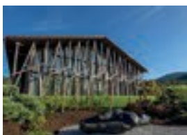
Boutique Hotel Lartor Weiherweg 34 82497 Unterammergau 31 Betten Verpflegung möglich