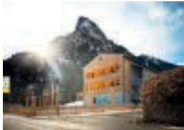
Jugendherberge Oberammergau Malensteinweg 10 82487 Oberammergau 142 Betten nur Frühstück möglich