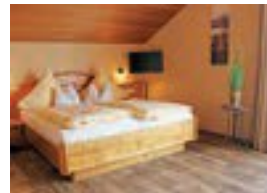
Kurbad St. Martin *** Prentstr. 9 82433 Bad Kohlgrub 28 Betten nur Frühstück möglich