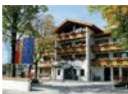
Hotel Maximilian Ettaler Str. 5 82487 Oberammergau 41 Betten Verpflegung möglich