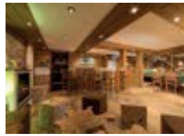
Parkhotel Sonnenhof **** König-Ludwig-Str. 12 82487 Oberammergau 125 Betten Verpflegung möglich