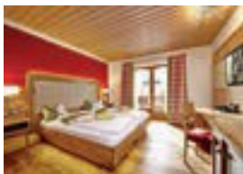
Hotel am Wiesenhang ***S Prentstr. 14 - 18 82433 Bad Kohlgrub 44 Betten nur Frühstück möglich