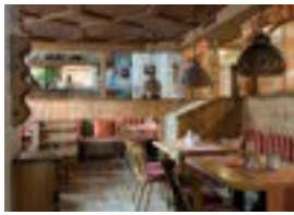
Hotel Wolf *** Dorfstr. 1 82487 Oberammergau 88 Betten Verpflegung möglich