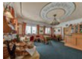
Kur- und Vitalhotel Sonnen ***S Sonnen 92a 82433 Bad Kohlgrub 28 Betten Verpflegung möglich