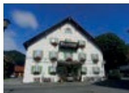
Hotel-Gasthof zur Rose ** Dedlerstr. 9 82487 Oberammergau 44 Betten nur Frühstück möglich